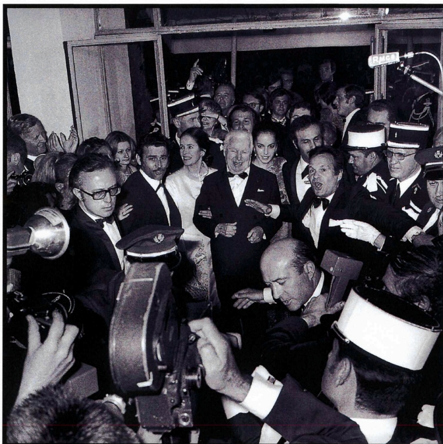
Charlie Chaplin et son épouse Oona et sa fille Joséphine Cannes 1971

Photographies Célébrités Mondiales du Cinéma 1966 – 1987 Textes JEAN CHARLES TACHELLA