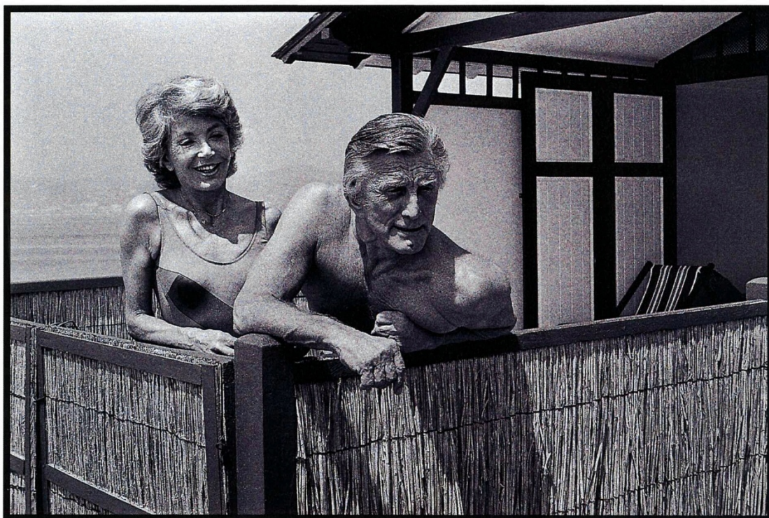
Kirk Douglas et son épouse Anne à l'hôtel du Cap-Eden-Roc Antibes 1979

Exposition : Arles du 1 er juillet au 15 août 2021